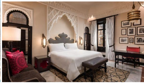
Yhteinen Illallinen Alfonso XIII hotellissa. Yöpyminen.